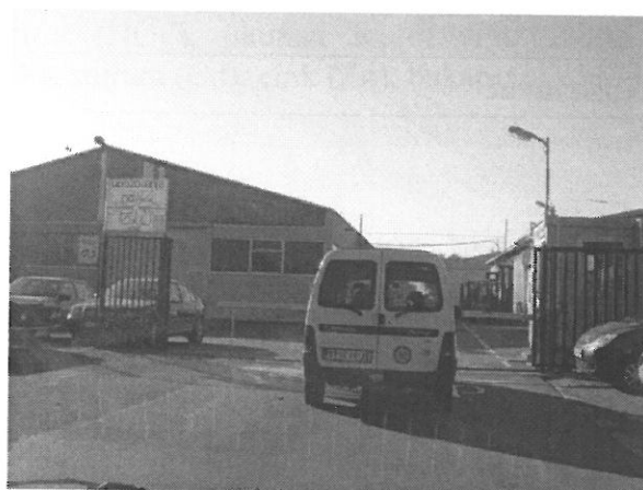
Slika 2. "Gorenje TIKI", Golubinački put bb, Stara Pazova

"Gorenje TIKI" se nalazi na adresi Golubinački put bb u Staroj Pazovi.